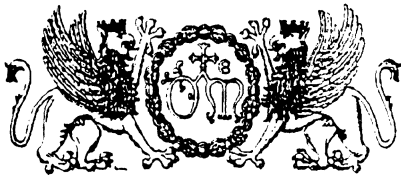
Stemmi dell'Ospedale di S. Maria della Misericordia di Perugia