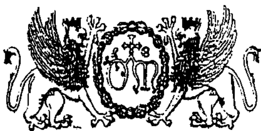
Stemmi dell'Ospedale di S. Maria della Misericordia di Perugia